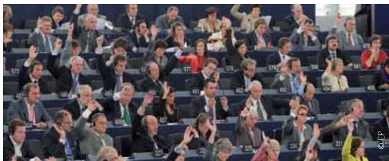
El Parlamento Europeo: tu voto es tu voz.

Tras las últimas elecciones al Parlamento Europeo, en junio de 2009, el ex primer ministro polaco Jerzy Buzek (Partido Popular Europeo) fue elegido Presidente del Parlamento por un período de dos años y medio.