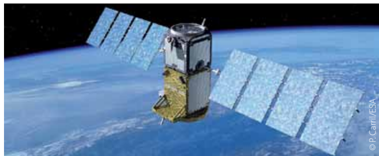
La UE fomenta la innovación y la investigación, por ejemplo en «Galileo», el sistema mundial de navegación por satélite de Europa.

La investigación conjunta al nivel de la UE está pensada para ser complementaria de los programas nacionales de investigación, centrándose en los proyectos que agrupan a varios laboratorios de distintos Estados miembros. Estimula los esfuerzos realizados en el campo de la investigación fundamental, como la fusión termonuclear controlada (fuente de energía potencialmente inagotable para el siglo XXI). Además, fomenta la investigación y el desarrollo tecnológico en sectores clave como la electrónica y la informática, que han de hacer frente a la férrea competencia del exterior.