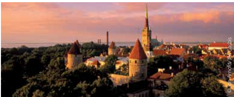
Tallin, capital de Estonia, donde el euro sustituyó a la corona en enero de 2011.