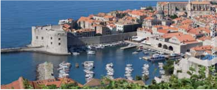
Dubrovnik, la «perla del Adriático», en Croacia, candidata a la adhesión a la UE.